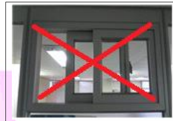
문을 열지 마세요.